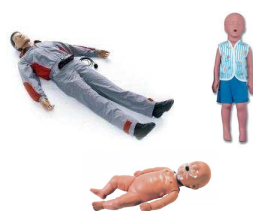
Mannequins de réanimation (dont enfants et nourrissons)