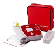
Défibrillateurs de formations